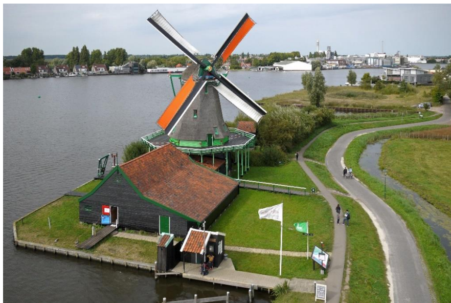
De Bonte Hen.

Op zaterdag 7 mei zal onze afdeling met PI4ZAZ meedoen aan het “Mills on the Air” event in de molen de Bonte Hen aan de Zaanse schans. Een aantal leden van onze afdeling hebben zich als vrijwilliger aangemeld om daar een station op te bouwen en verbindingen te maken. We hopen veel stations te werken. Om 9 uur kunnen we gaan opbouwen en hopen een uurtje later QRV te zijn met 2 sets op de HF (voornamelijk op 20m en 40m) en 1 set op VHF (PI3ZAZ) en UHF (PI2ZAZ).