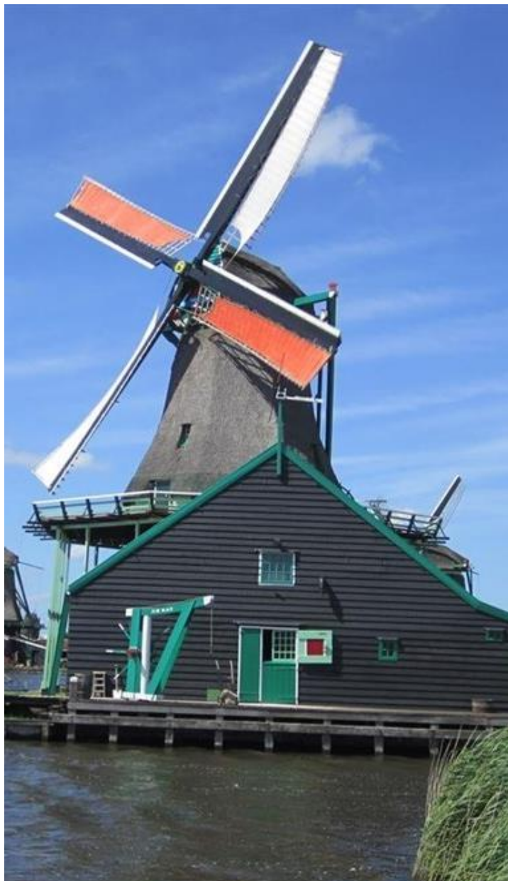
Verfmolen "De Kat" – Zaanse Schans

Vereniging voor Experimenteel Radio Onderzoek in Nederland